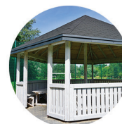
Wszelkich elementów z drewna